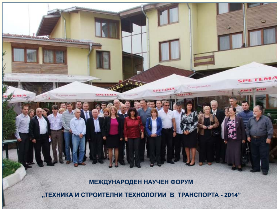
МЕЖДУНАРОДЕН НАУЧЕН ФОРУМ „ТЕХНИКА И СТРОИТЕЛНИ ТЕХНОЛОГИИ В ТРАНСПОРТА - 2014”